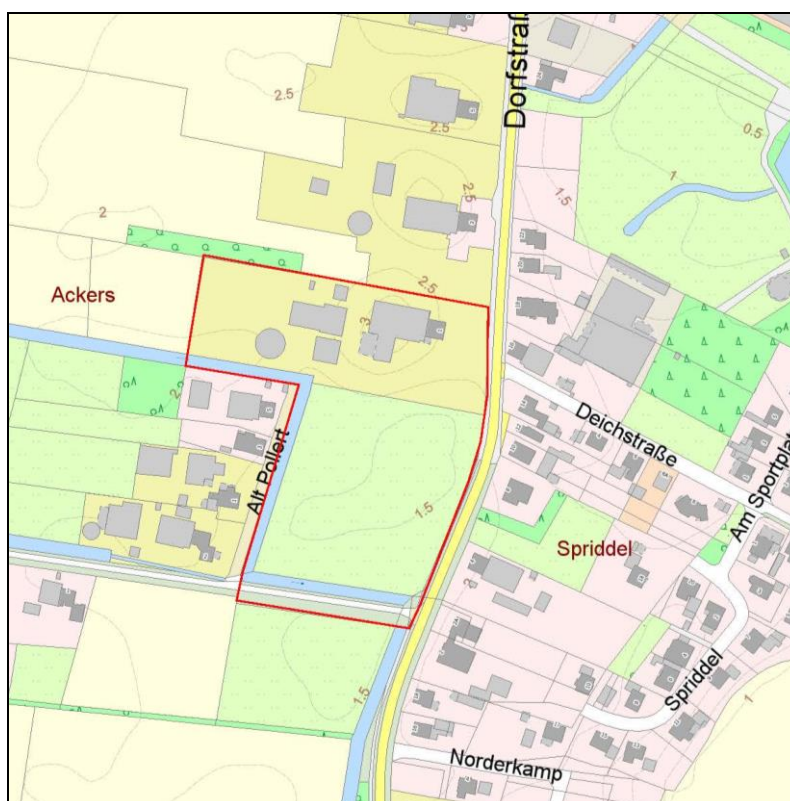
Abbildung 1: Übersichtskarte, rote Umgrenzung = Geltungsbereich B-Plan Nr. 9